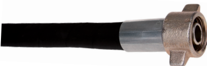
Hochdruckverpressung Sertissage haute pression