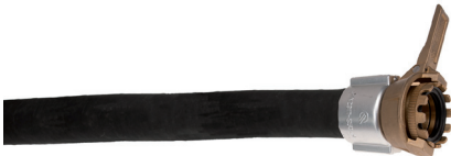
Klemmschalen mit Stift Coquilles de serrage avec goupille