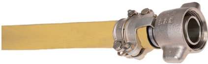
Schlauchklemme SK und SL Colliers de serrage SK et SL