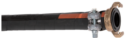
Schlauch-Schelle "ABA ROBUST"