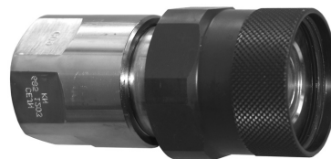
Muffen mit Innengewinde Douilles avec filetage intérieur