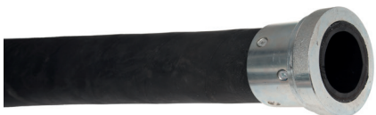
Mörtelschlauchkupplung aussen verschraubt Accouplement pour tuyau à mortier, vissé depuis l'extérieur