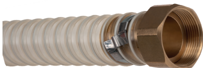
Brückenschelle Collier de serrage à pont