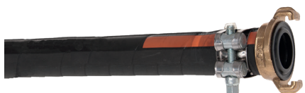
Schlauch-Schelle "ABA ROBUST" Collier de serrage "ABA ROBUST"