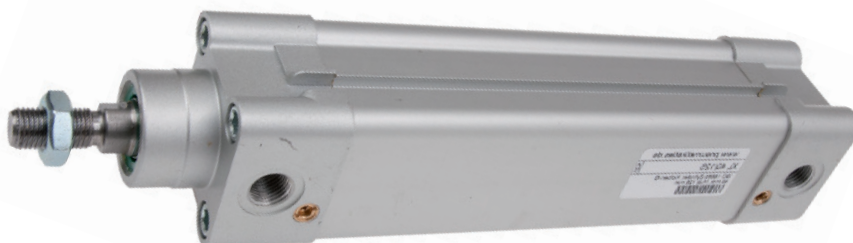
Table de dimensions pour cylindres profilés ISO 15552

Masstabelle für Profil-Zylinder ISO 15552