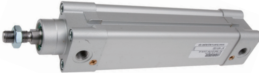
Table de dimensions pour cylindres profilés ISO 15552

Masstabelle für Profil-Zylinder ISO 15552